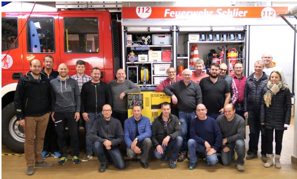
Beispielbild: Kreisausbilder Maschinisten am 28.11.2018 in Schlier

Fester Bestandteil im Terminkalender des Kreisbrandmeisters - mit seiner Verwaltung - sind die Jahresbesprechungen der Kreisausbilder zum Ende eines jeden Ausbildungsjahres. Schwerpunkte hierbei sind die Terminplanungen für die Kreislehrgänge des Folgejahres sowie der fachliche Austausch im Sinne einer einheitlichen Lehrmeinung für die Feuerwehren des Landkreises. Die Lehrgänge sind ab sofort über syBOS buchbar. Die Kommandanten wurden von der Kreisverwaltung bereits entsprechend benachrichtigt. Wir weisen an dieser Stelle nochmals gerne darauf hin, dass sämtliche buchbaren Lehrgänge unter Link offen für Jedermann einsehbar sind. Wir ermöglichen hierdurch unseren Auszubildenden eine optimale Lehrgangsplanung in Bezug auf Örtlichkeit und Zeitraum .