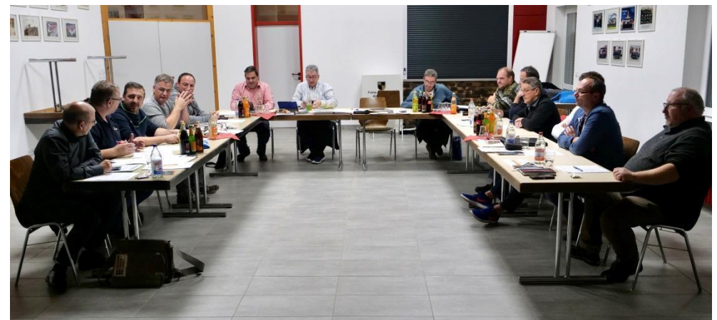
Bild: Der Kreisfeuerwehrausschuss des Landkreises Ravensburg in Altshausen

Verbands-Ehrungsanträge werden vom Vorsitzenden gerne noch bis 31. Dezember entgegengenommen. Kontakt: vorsitzender@kfv-rv.de .