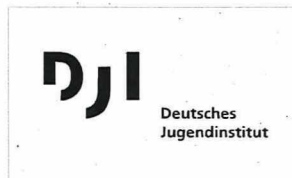
Deutsches Jugendinstitut München