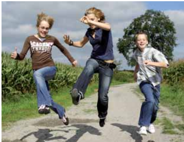
Spaß an viel Bewegung