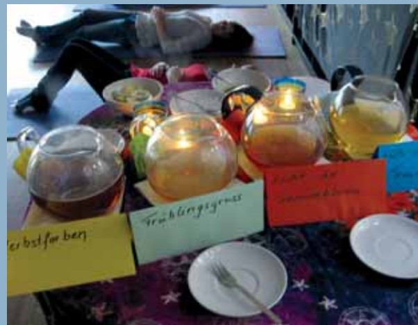
Entspannung bei der Teezeremonie