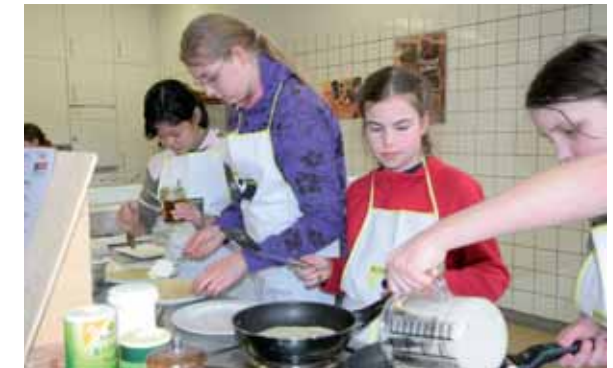
Selber kochen beim Koch-Workshop