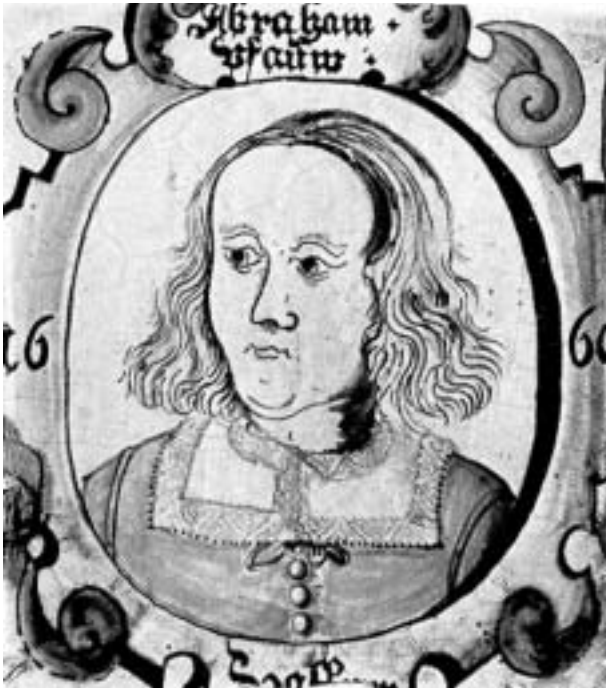
Frieskachel mit Selbstbildnis von Abraham Pfau, 1660.