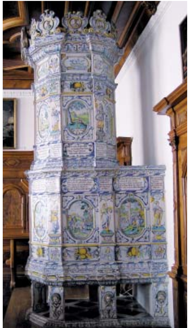
Der Kachelofen im Erkersaal des Rathauses von Isny.