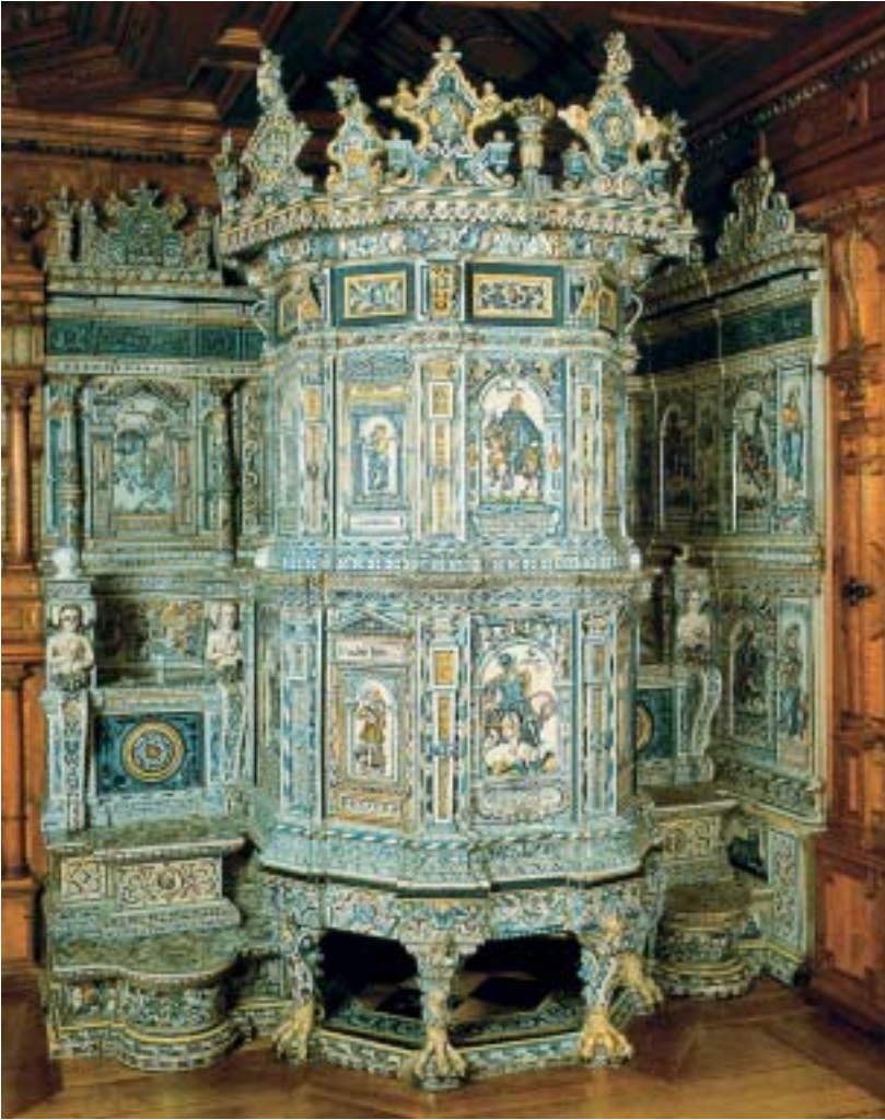
Winterthurer Ofen aus dem alten Seidenhof – Zürich 1620, von Ludwig Pfau II (Schweiz. Landesmuseum Zürich).

das Wissen um das Geheimnis der Fayenceherstellung und die sichere Pinselführung eines Ofenmalers. Alles beginnt mit der sorgfältigen Aufbereitung des Tons und der Ausformung der Kacheln; es folgt das Zubereiten der Fayenceglasur sowie das Mischen der Scharffeuerfarben, das Glasieren und Bemalen, das Brennen der Kacheln, das in mehreren Stufen und unterschiedlichen Temperaturen stattfand, der Transport und das Setzen des Ofens.