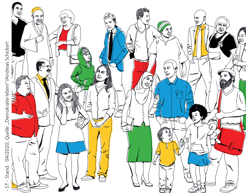
LRA RV - ST - Stand: 04/2020; Quelle: „Demokratie leben!“/Andreas Schickert